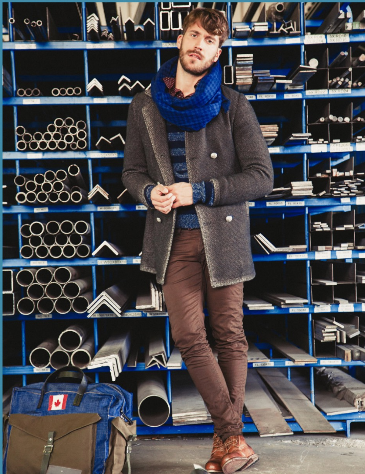
Schal LALA Berlin 94259 / Jacke GMS75 44422 / Pullover Roberto Collina 34453 / Chino The NIM 14951 / Stiefel Shoto 52309 Tasche Dsquared2