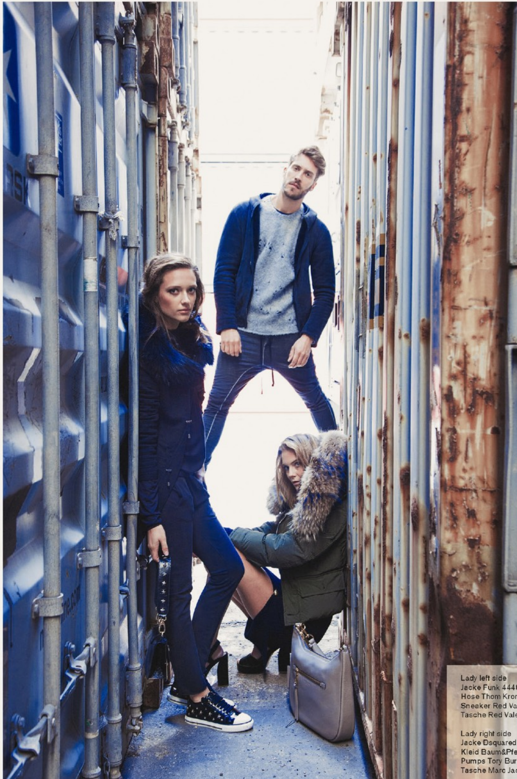
Lady left side Jacke Funk 44489 Hose Thom Krom 14880 Sneaker Red Valentino 52366 Tasche Red Valentino 94083