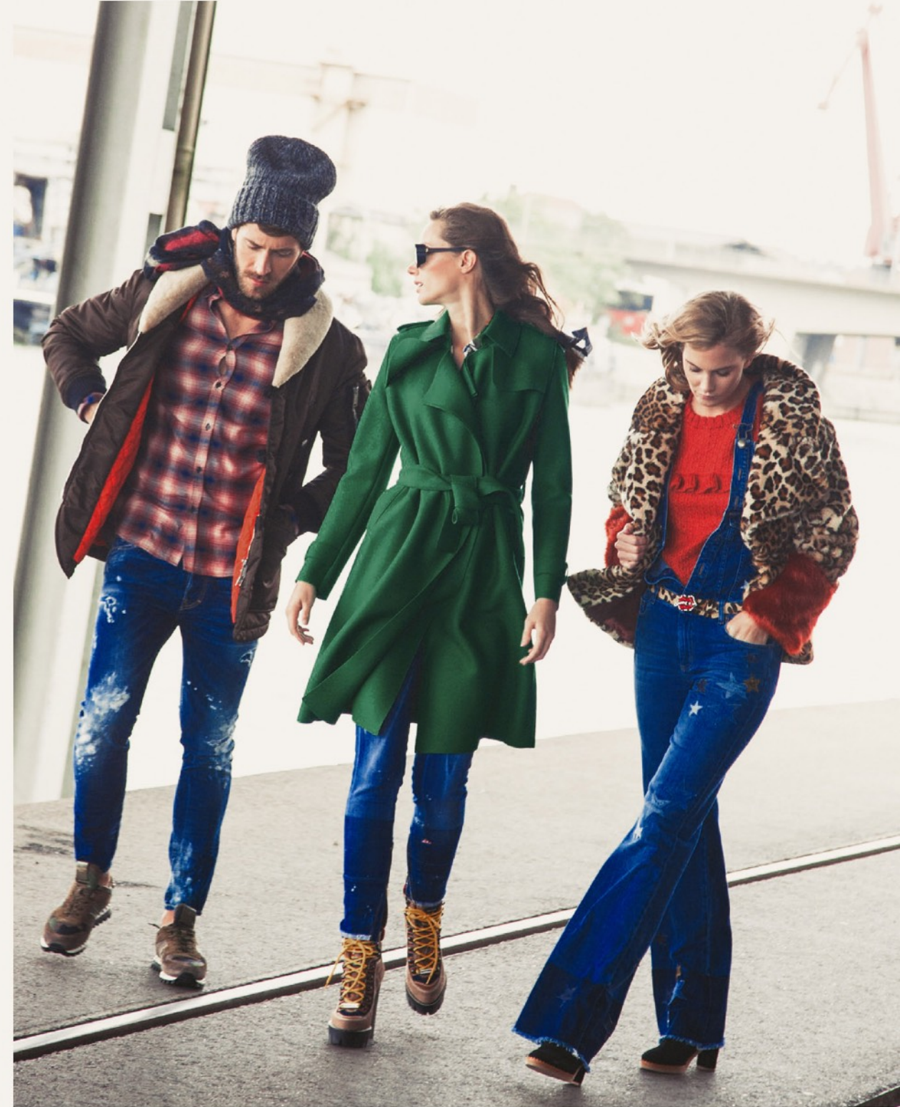
Man: Mütze Dsquared2 44466 / Jacke Dsquared2 34717 / Hose Dsquared2 14819 / Sneaker Valentino 52344 First Lady: Mantel Harris Wharf London 44534 / Jeans Dsquared2 14965 / Brille Mykita Second Lady: Jacke Baum&Pferdgarten 44510 / Overall Red Valentino 34266