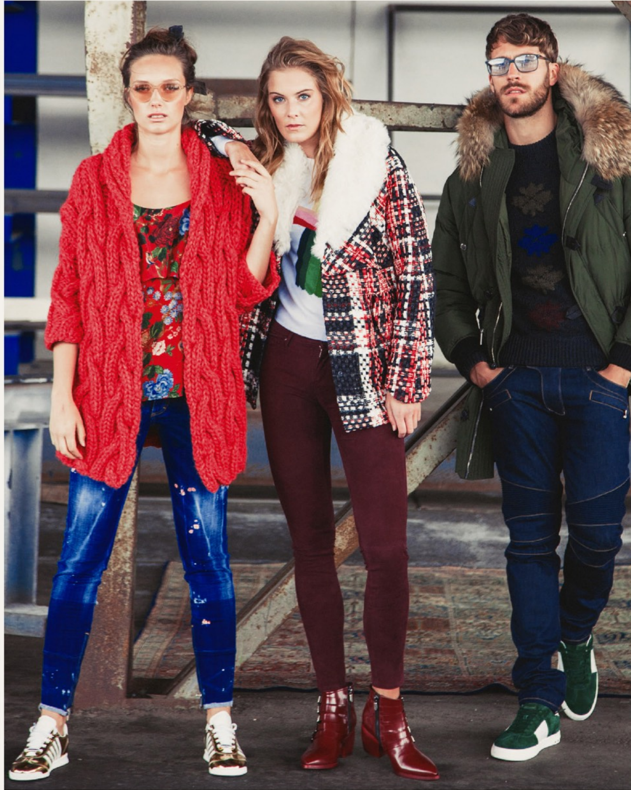
First Lady: Strickjacke Ultra 44458 / Top Alice&Olivia 34793 / Jeans Dsquared2 14965 / Sneaker Dsquared2 52352 / Brille Reiz Second Lady: Jacke Paul&Joe 44563 / Pullover N°21 34830 / Hose Adriano Goldschmied 14960 / Stiefel RoccoP 52418 Man: Parke Dsquared2 44507 / Pullover Dsquared2 34632 / Jeans Balmain 14544 / Sneaker Valentino 52415 / Brille Reiz