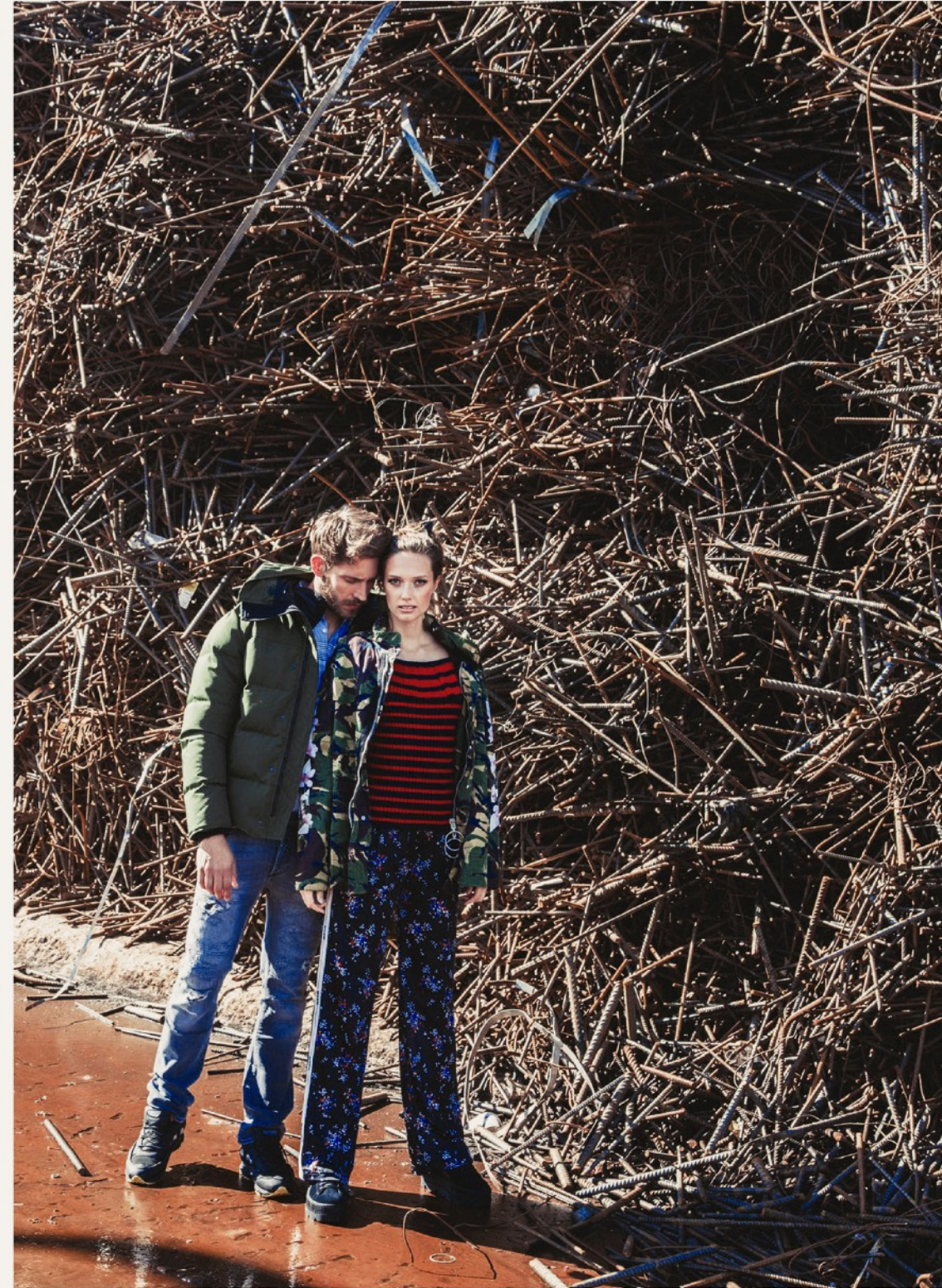
Man: Jacke Kenzo 44574 / Hemd Dsquared2 34217 / Jeans Marcelo Burlon 14860 / Sneaker Adidas Raf Simons 52428 Lady: Parka Off-White 44576 / Pullover MSGM 34351 / Hose MSGM 14939 / Sneaker Puma by Rihanna 52425