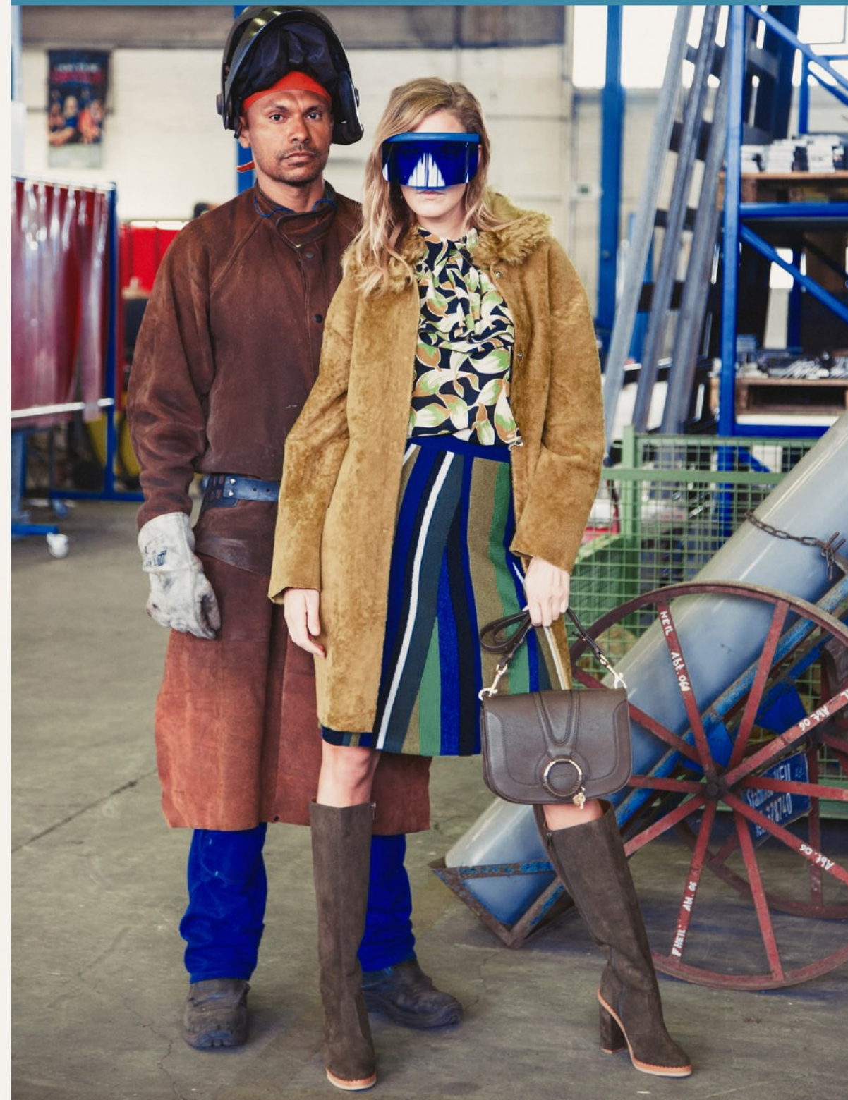
Mantel Giorgio Brato (ausverkauft) / Bluse N°21 34561 / Rock Roberto Collina 34568 / Stiefel See by Chloé 52391 Tasche See by Chloé 94134 / Brille Mykita