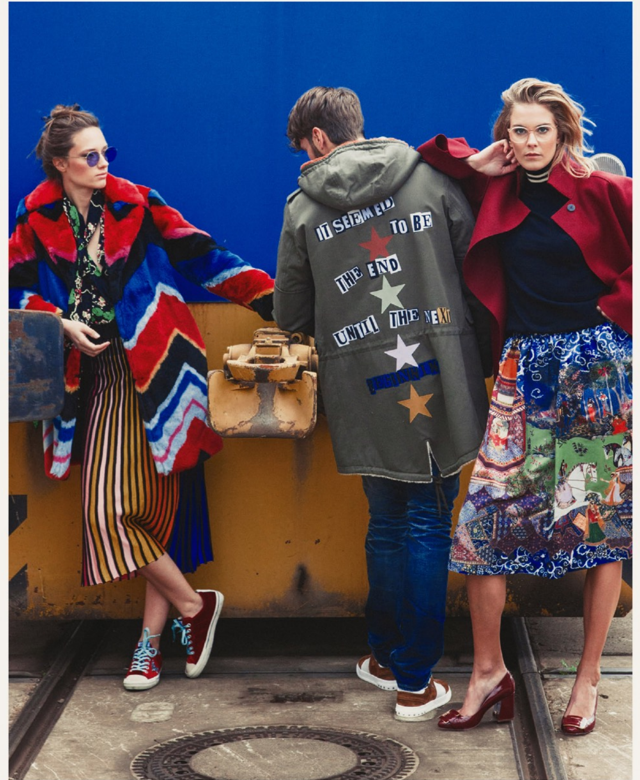
Lady left side: Mantel Alice&Olivia 44539 / Bluse Rixo London 34839 / Rock Kenzo 34833 / Sneaker Golden Goose 52437 / Brille Mykita Man: Parka Valentino 44471 / Hodie Valentino 34324 / Jeans Citizens of Humanity 14687 / Sneaker Valentino 52399 Lady right side: Mantel Harris Wharf London 44539 / Pullover N°21 34678 / Rock Alice&Olivia 34795 / Schuhe Tory Burch 52393 Brille Reiz