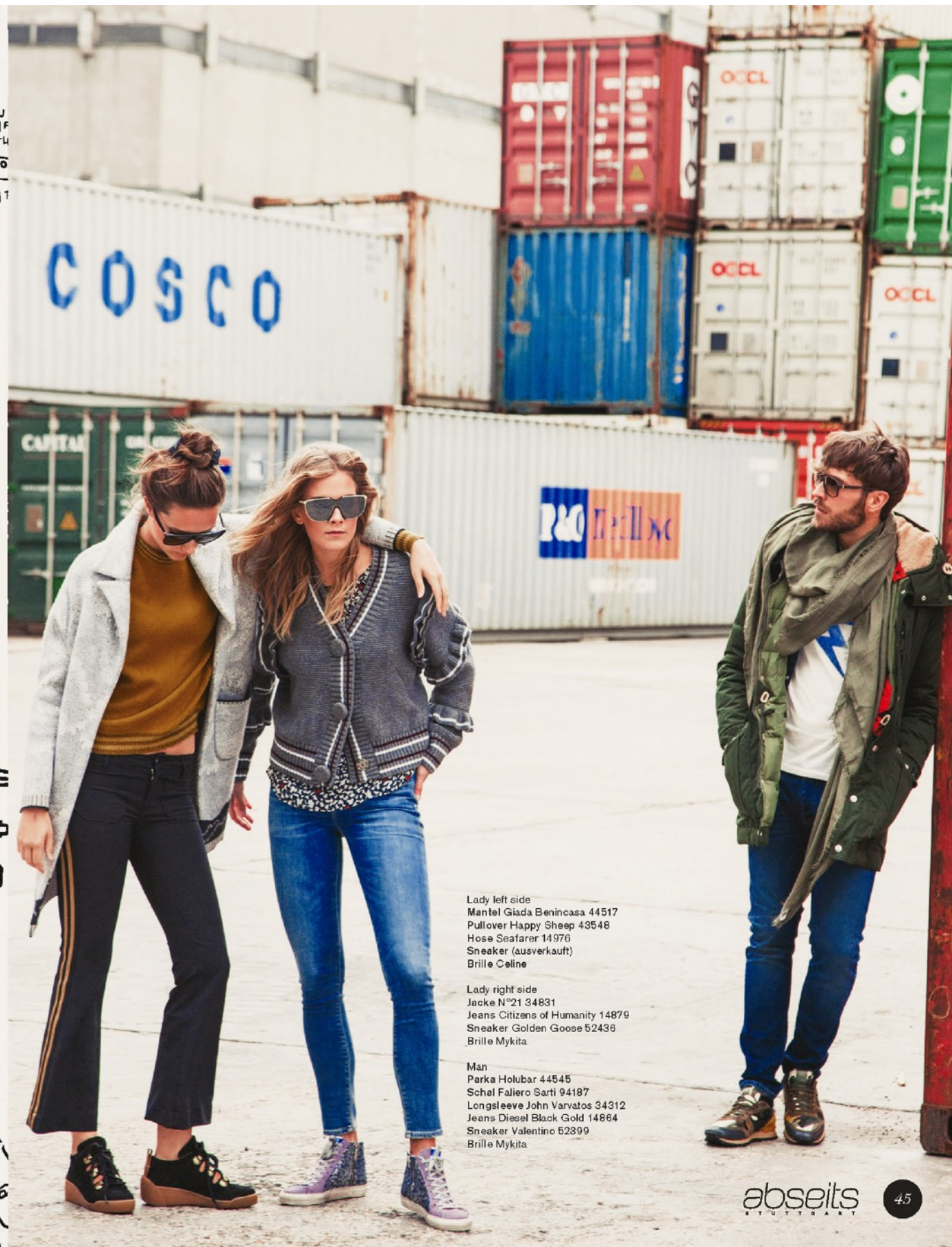
Lady left side Mantel Giada Benincasa 44517 Pullover Happy Sheep 43548 Hose Seafarer 14976 Sneaker (ausverkauft) Brille Céline Lady right side Jacke N°21 34831 Jeans Citizens of Humanity 14879 Sneaker Golden Goose 52436 Brille Mykita Man Parka Holubar 44545 Schal Faliero Sarti 94187 Longsleeve John Varvatos 34312 Jeans Diesel Black Gold 14864 Sneaker Valentino 52399 Brille Mykita