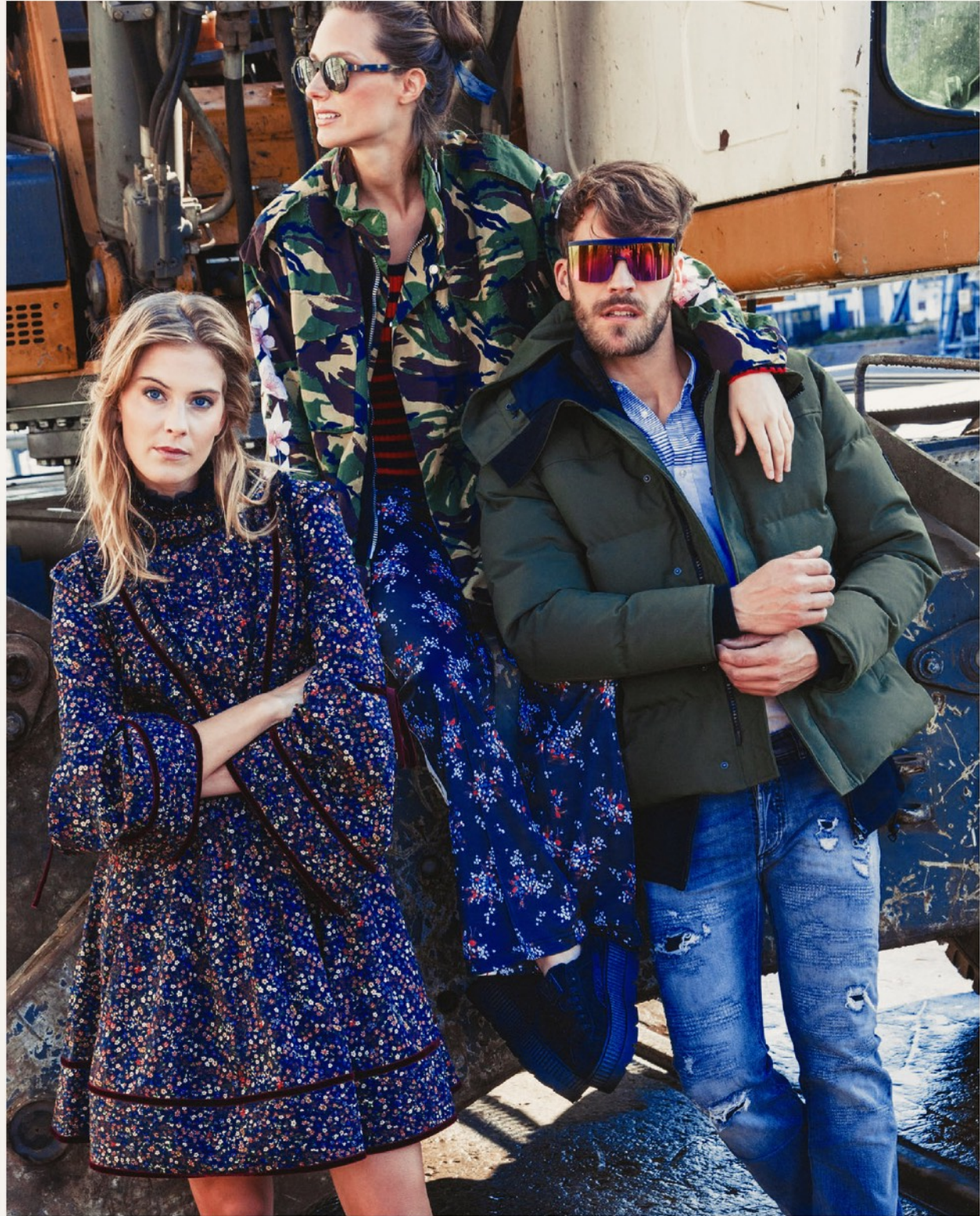
Lady left side: Kleid Dsquared2 34822 Man: Jacke Kenzo 44574 / Hemd Dsquared2 34217 / Jeans Marcelo Burlon 14860 / Sneaker Adidas Raf Simons 52428 / Brille Mykita Lady right side: Parka Off-White 44576 / Pullover MSGM 34351 / Hose MSGM 14939 / Sneaker Puma by Rihanna 52425 / Brille Mykita