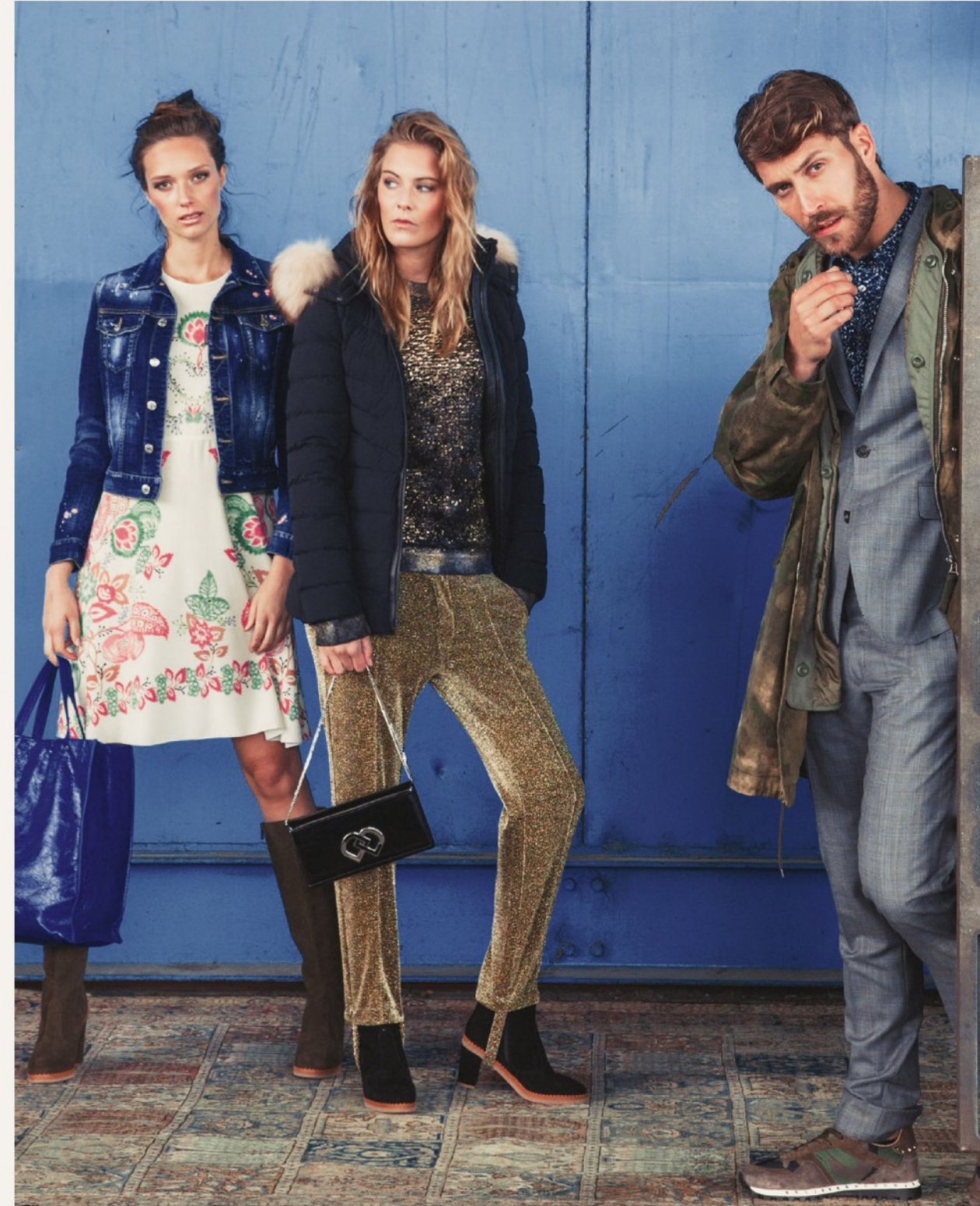
Lady left side: Jeansjacke Dsquared2 44572 / Kleid Red Valentino 34737 / Boots See by Chloé 52391 Tasche Valentino 94078 Lady right side: Jacke Mackage 44553 / Oberteil Avant Toi 34495 / Hose Golden Goose 14971 Stiefel See by Chloé 52392 / Tasche Dsquared2 93830 Man: Parka Golden Goose 44578 / Anzug Dsquared2 60219 / Hemd Paul&Joe 34711 / Sneaker Valentino 52341