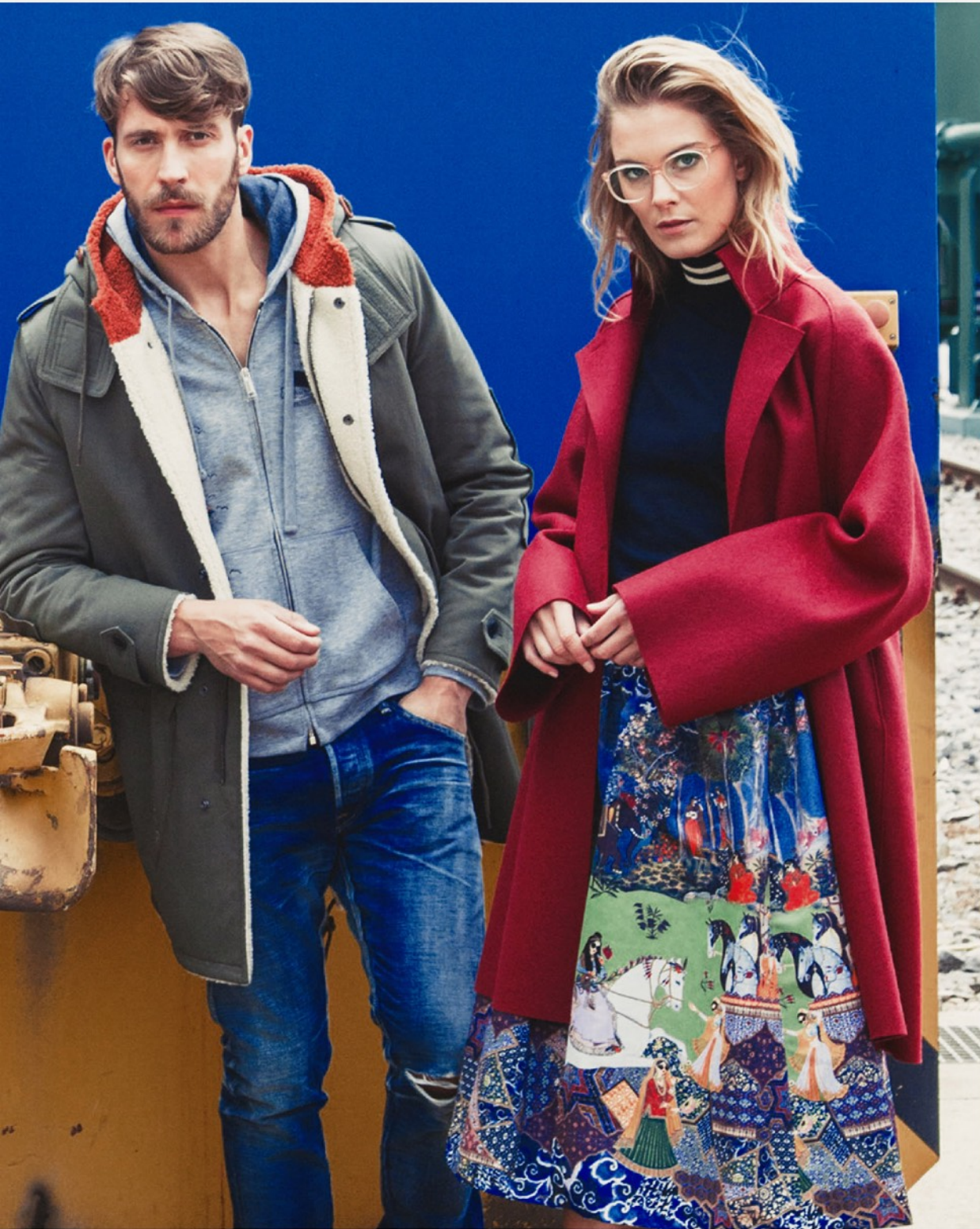
Man: Parka Valentino 44471 / Hodie Valentino 34324 / Jeans Citizens of Humanity 14687 Lady: Mantel Harris Wharf London 44539 / Pullover N°21 34678 / Rock Alice&Olivia 34795 / Brille Reiz