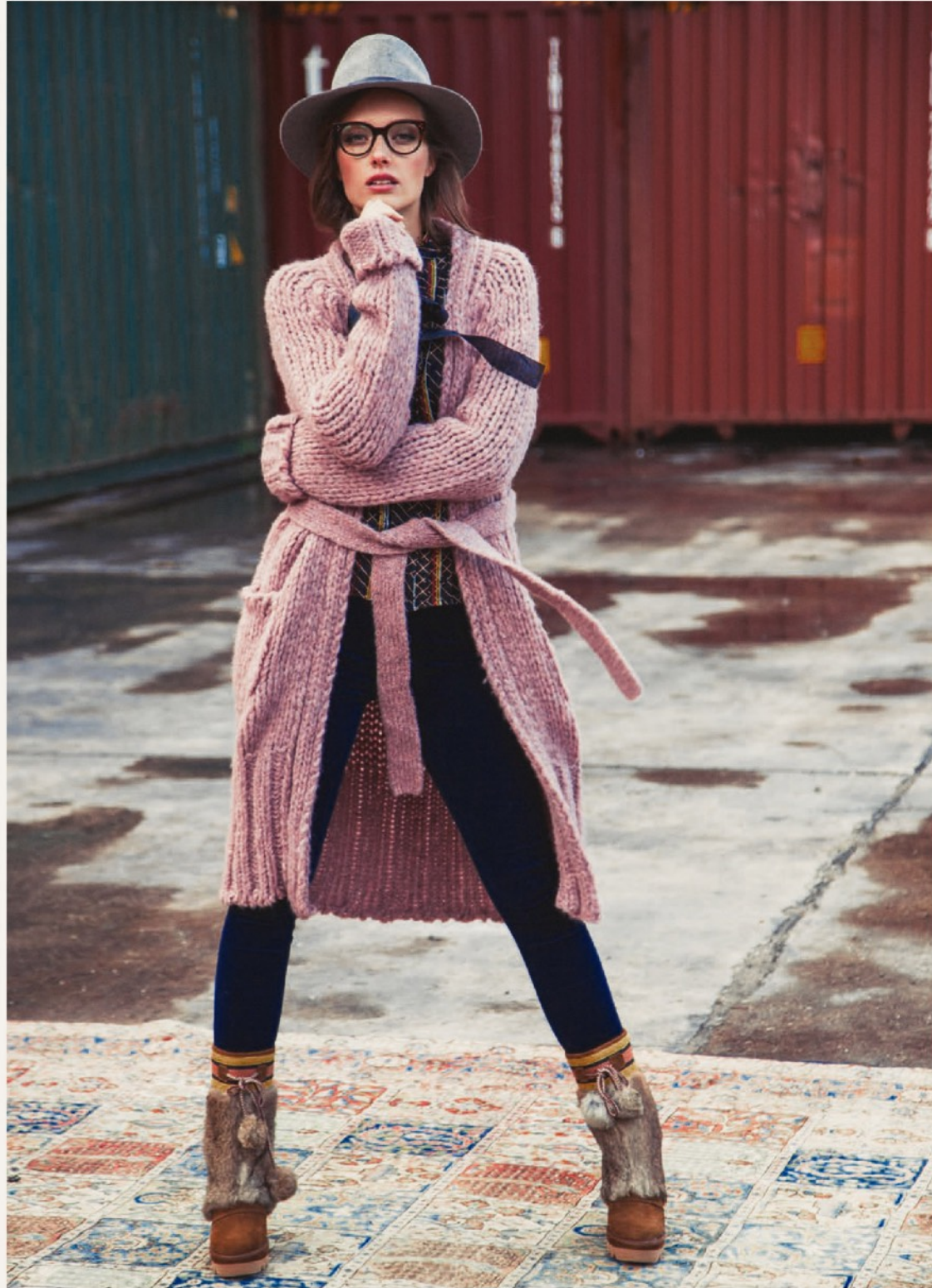
Hut Rag&Bone 93933 / Mantel Roberto Collins 44408 / Bluse Lala Berlin (ausverkauft) / Jeans Rag&Bone 14293 Boots See by Chloé 52389 / Brille Celine