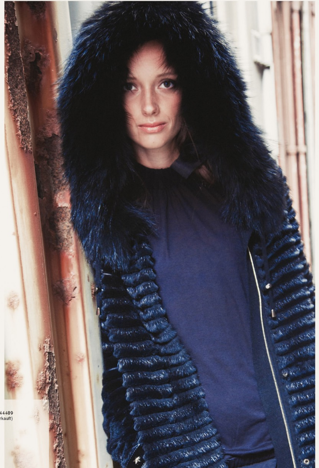
Lady Jacke Funk 44489 Shirt (ausverkauft)