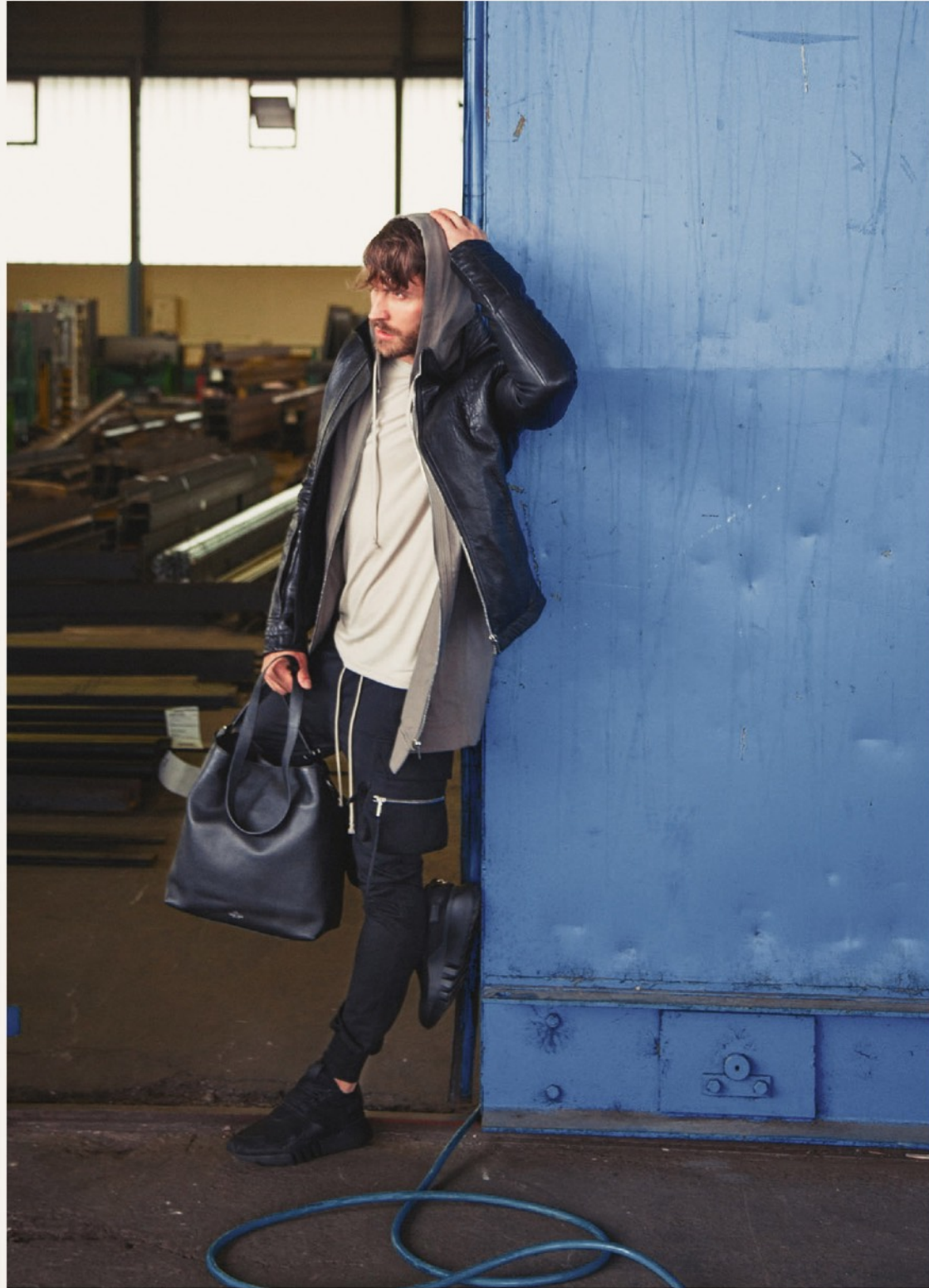
Lederjacke Rick Owens 44429 / Hoodie Rick Owens 44468 / T-Shirt Thom Krom 34384 / Hose Rick Owens 14937 Sneaker Adidas Y-3 52429 / Tasche Valentino 94079