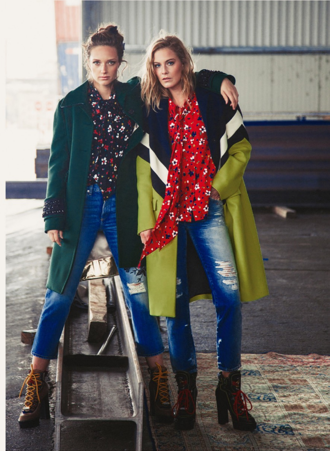
Lady left side: Mantel N°21 44431 / Bluse Marc Jacobs 34152 / Jeans Citizens of Humanity 14942 / Stiefel Dsquared2 52403 Lady right side: Mantel MSGM 44566 / Bluse Marc Jacobs 34151 / Jeans Adriano Goldschmied 14957 / Stiefel Dsquared2 52377