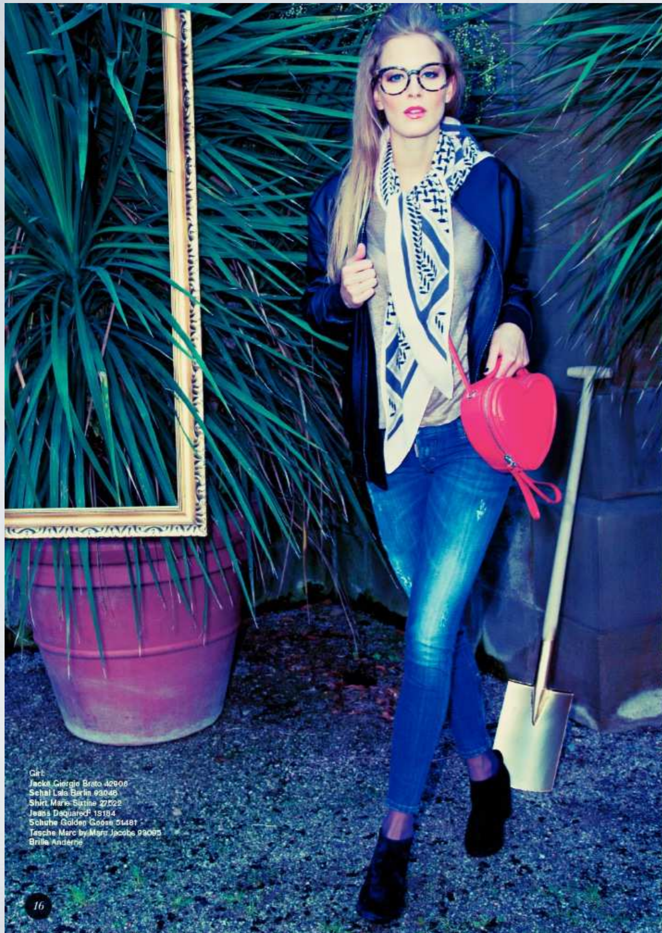
Girl: Jacke Giorgio Brato 42906 Sehtal Lala Berlin 93048 Shirt Marie Sixtine 27522 Jeans Daquard 13194 Schuhe Golden Goose 51481 Tasche Marc by Marc Jacobs 93095 Brille Andérne