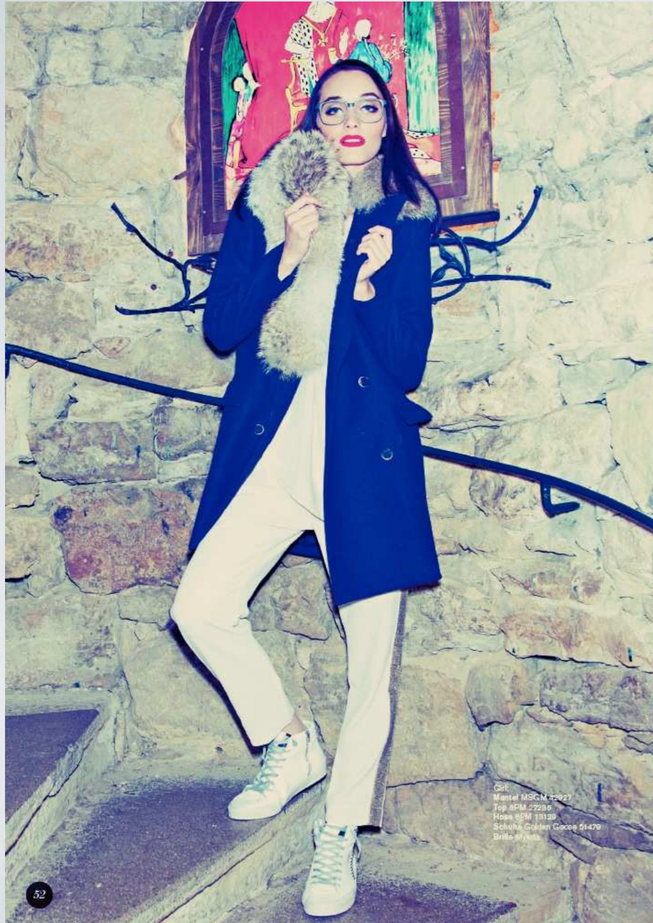
Girl Mantel MSGM 42827 Top 6PM 27295 Hose 6PM 18129 Schuhe Golden Goose 01479 Brille Mykita