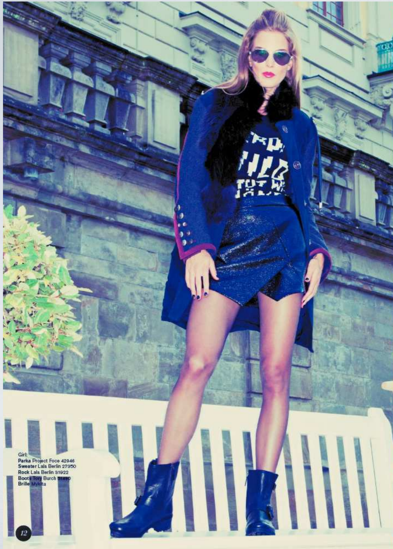
Girl: Parka Project Face 42946 Sweater Lala Berlin 27350 Rock Lala Berlin 31922 Boots Tory Burch 91490 Brille Mykita