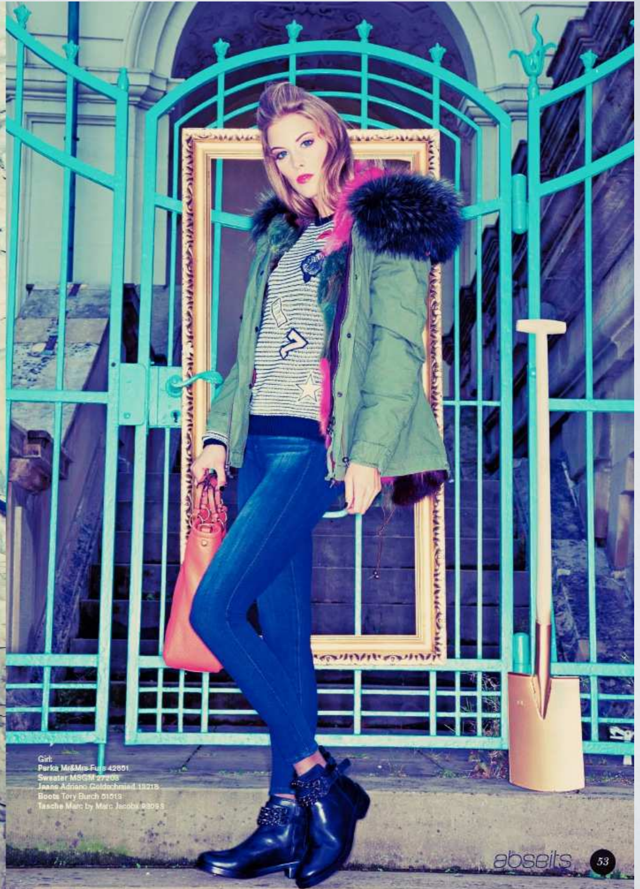
Girl Perka Mr&Mrs Furs 42801 Sweater MSGM 27295 Jeans Adriano Goldschmied 18015 Boots Tory Burch 01013 Tasche Marc by Marc Jacobs 83093