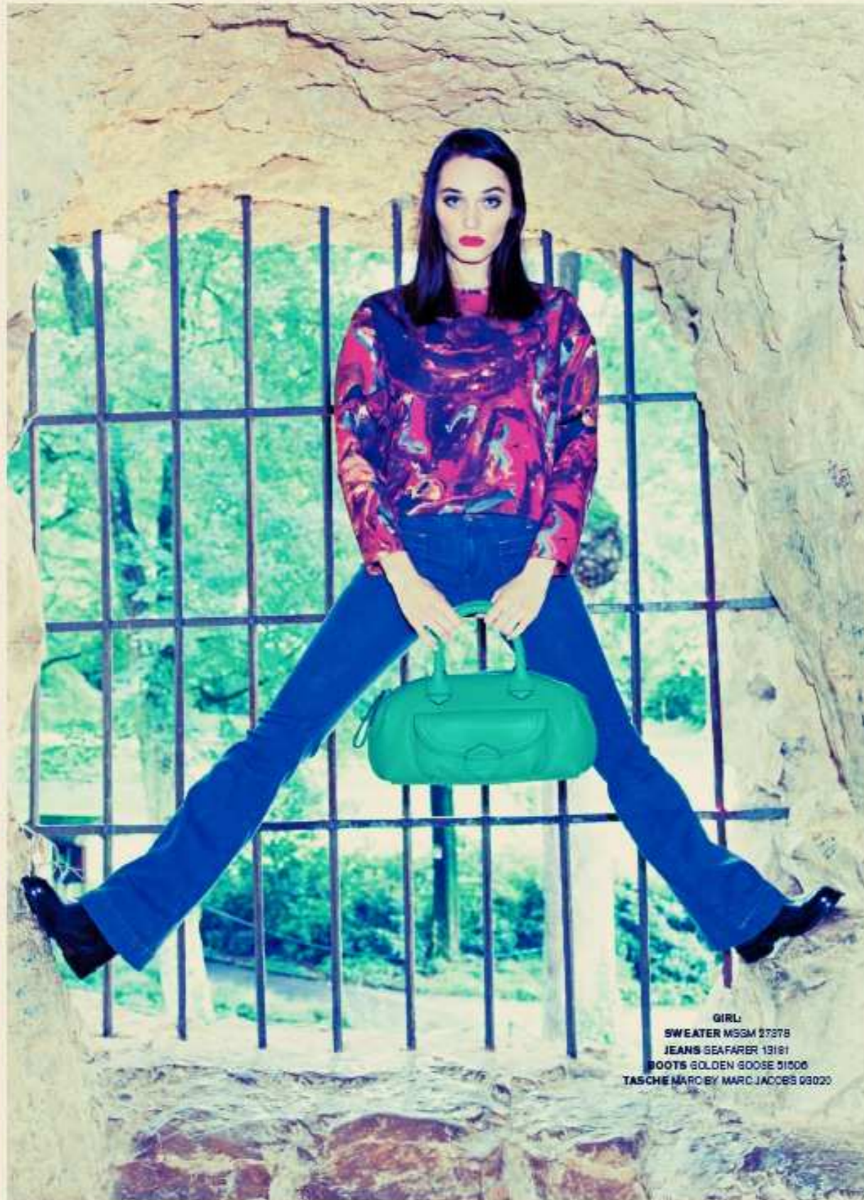
GIRL: SWEATER MSGM 27378 JEANS SEAFARER 13181 BOOTS GOLDEN GOOSE 51500 TASCHÉ MARC BY MARC JACOBS 03020