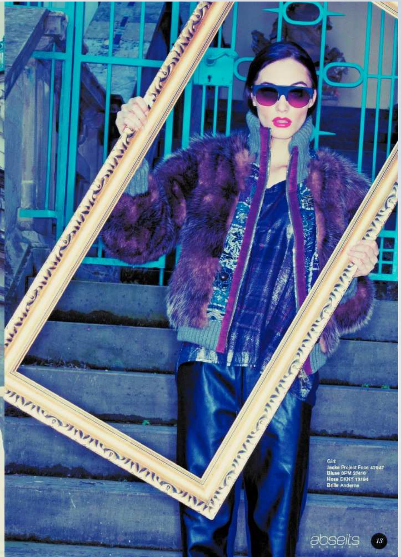
Girl: Jacke Project Face 42947 Bluse BPM 27416 Hose DKNY 13194 Brille Andere