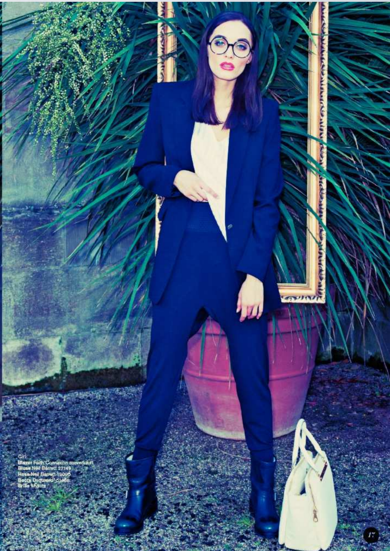
Girl: Blazer Faith Connexion ausverkauft Bluse Neil Barrett 27149 Hose Neil Barrett 19099 Boots Daquard 51466 Brille Myra