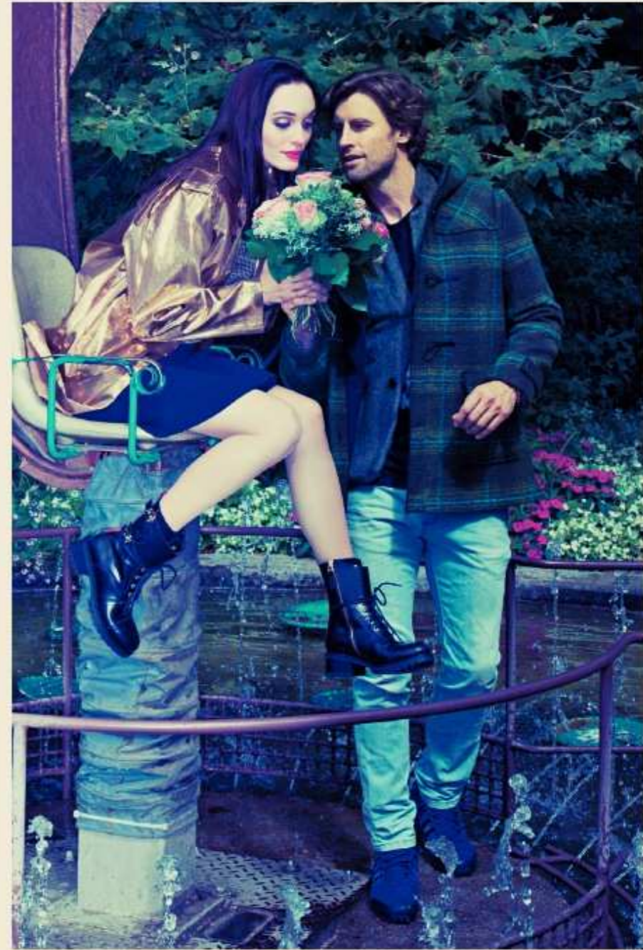
GIRL: MANTEL MSGM 42977 KLEID NEL BARRETT 31893 BOOTS CHIARA FERRAGNI 51499