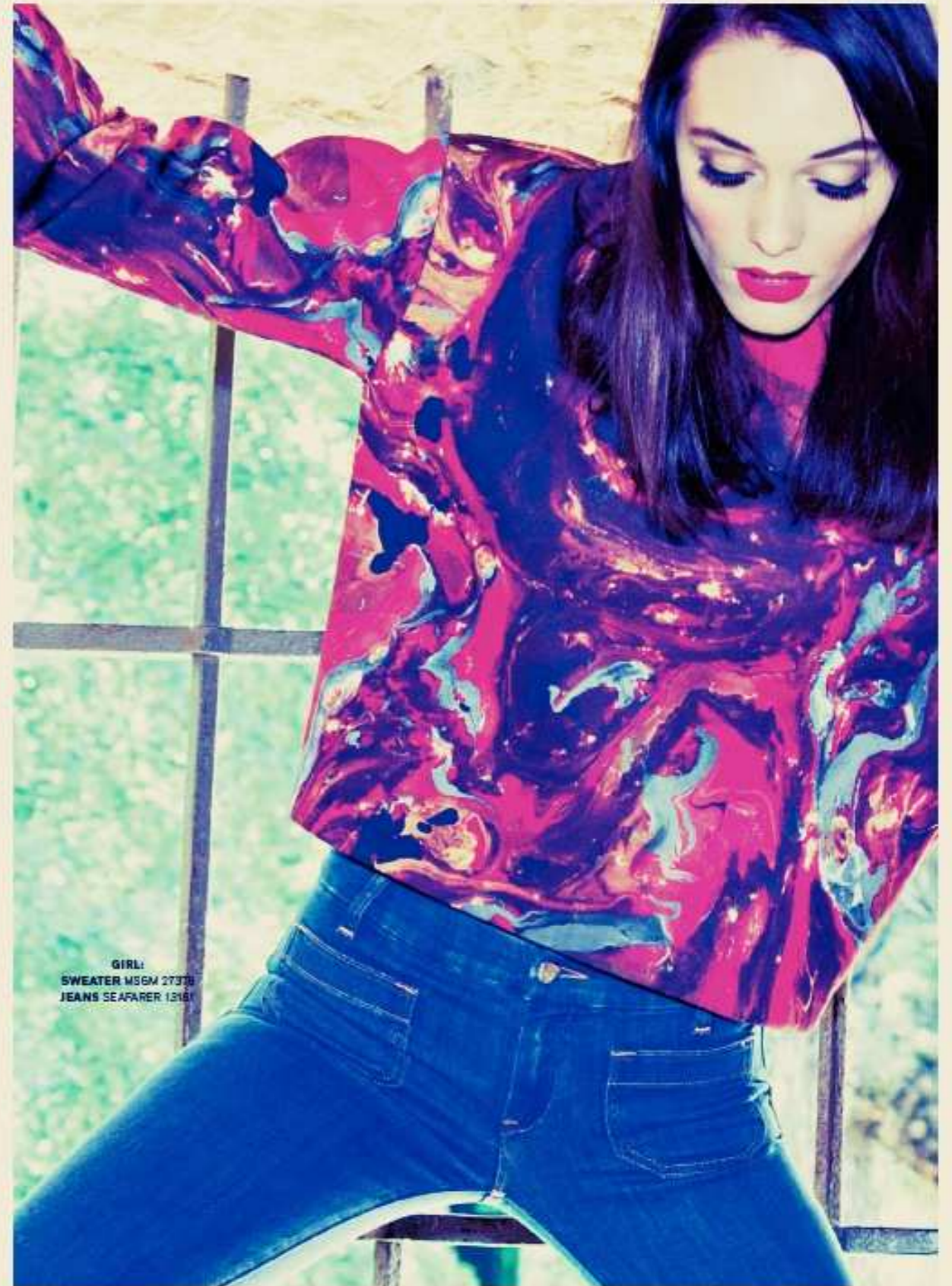
GIRL: SWEATER MSGM 27378 JEANS SEAFARER 13181