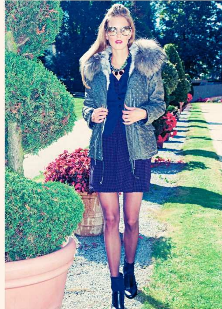
Left Boy: Blazer Neil Barrett 42838, T-Shirt Giorgio Brato 27275, Jeans Dsquared 2 13099, Schuhe Golden Goose 51508, Brille Mykita Left Girl: Blazer Abseits 42942, Tuch Faliero Sarti 92931, Bluse Tory Burch 27423, Jeans Paige 13209, Schuhe Chiara Ferragni 51498 Tasche Marc by Marc Jacobs 93118, Brille Andeme Right Girl: Parka Mr&Mrs Furs 42879, Blazer Patrizia Pepe 43056, Kleid Tory Burch 31466, Schuhe Neil Barrett 51466 Kette Vanessa Baroni 92985, Brille Andeme